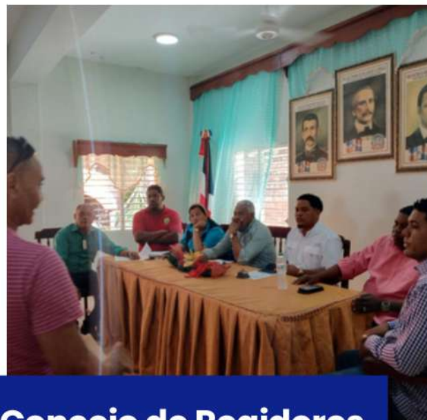
Concejo de Regidores

Enriquillo, Barahona. En la mañana del martes 7 de enero, el Ayuntamiento Municipal de Enriquillo fue escenario de un importante encuentro ciudadano durante la Asamblea de Cabildo Abierto. Esta actividad marcó un hito en la gestión participativa, donde se presentó, discutió y aprobó el Plan de Inversión del Presupuesto Participativo Municipal (PPM) para el año 2025, junto con la conformación del Comité de Seguimiento y Control.